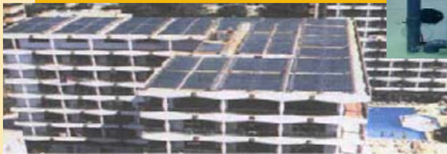
Figura 3. Campo de colectores de vacío en la cubierta del Hotel Belroy Palace

No obstante, y como dice el refrán, el tiempo lo cura todo, incluida la fobia o el exceso de celo mostrado por parte de algunas administraciones y la falta de rigor de los medios de comunicación al abordar este tema. Y espero que esta actitud pase pronto ya que las torres de refrigeración tienen mucho que aportar en los campos de la eficiencia energética y de la reducción de emisiones de CO 2 (Protocolo de Kioto) con los que nuestra sociedad, al