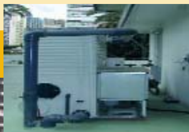
Figura 4. Torre de refrigeración (Hotel Belroy Palace)