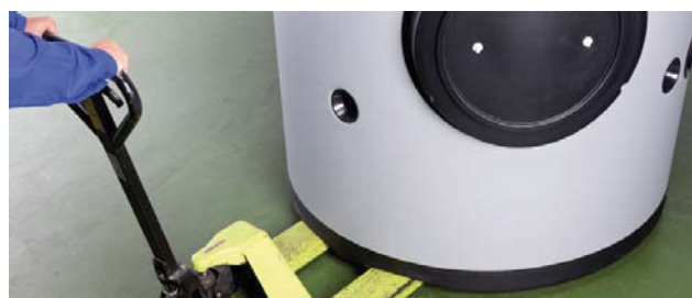
SISTEMA DE TRANSPORTE: Aberturas/conductos bajo el depósito para facilitar la manipulación con transpaletas (a partir de 1.500 litros).

Además disponen de cáncamos de elevación en la parte superior, para el caso de necesidad de ubicación del depósito en zonas elevadas y tener que ser izado con pluma de carga.